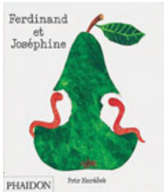
Ferdinand et Joséphine de Petr Horacek Ed. Phaidon

Ferdinand et Joséphine sont deux vers. Chacun vit dans son coin, de chaque côté d'un arbre. Un jour, une belle... grosse... poire juteuse tombe par terre entre les deux protagonistes. Ferdinand la grignote du côté gauche, Joséphine la grignote du côté droit... les deux vers se retrouvent bientôt dans une situation indémêlable !